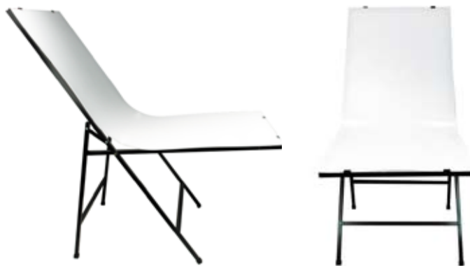
Стол в сборе. (вид сбоку и спереди)